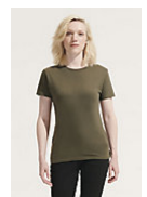
SOL'S REGENT WOMEN 01825